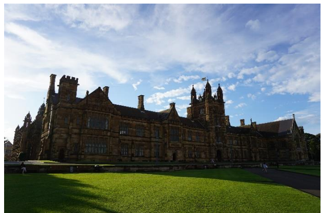
Bilder: The University of Sydney Business School (links) und das Quadrangle (rechts)

Wie bereits erwähnt, spezialisierte ich mich während meines Auslandssemesters auf Kurse, die sich u.a. mit der Luftfahrtbranche beschäftigten. Meine drei ausgewählten Module mit jeweils sechs australischen Credit Points waren demnach die Kurse Airline Strategy and Supply Chains , Global Freight Logistics Management sowie Cases in Global Transport Management .